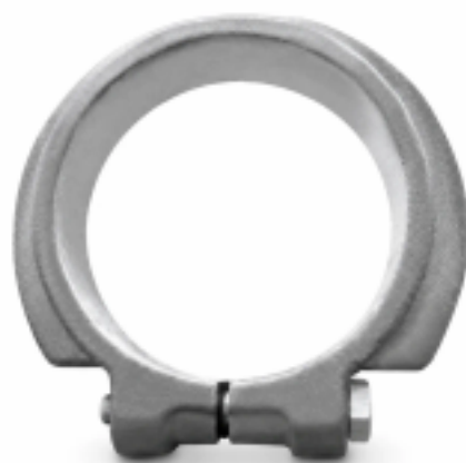
Гайка оси балансира