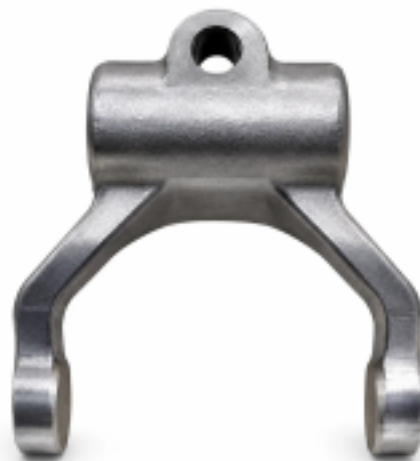
Вилка выключения сцепления