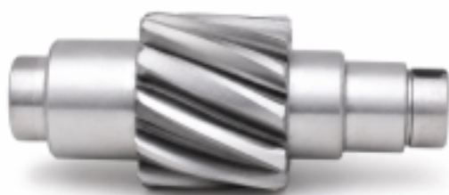
Ведущая цилиндрическая шестерня 5320-2402110-10