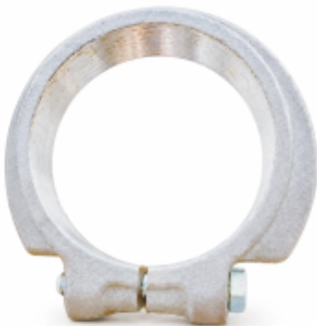
Гайка оси балансира