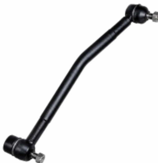
Тяга рулевая в сборе