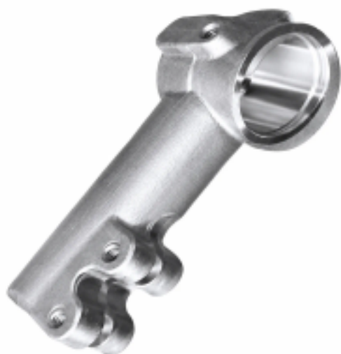
Корпус наконечника рулевой тяги