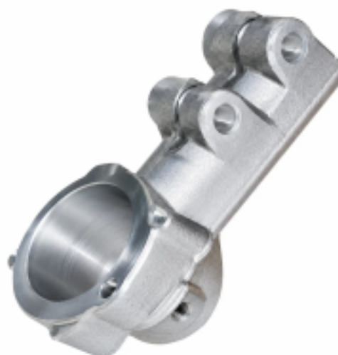
Корпус наконечника рулевой тяги