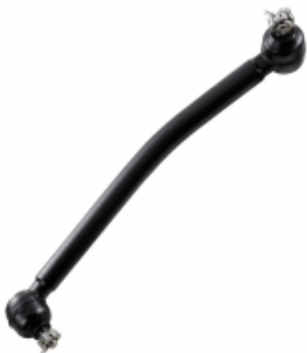
Тяга рулевая в сборе